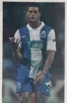
Hulk, do Porto, é conhecido por ser forte e ter chute "demolidor"

Tecnologia da Informação, Engenharia e Medicina são atividades prósperas. Salários de até 15 mil. Goiás abre espaço para milhares de oportunidades. Consultores de Recursos Humanos apontam melhores alternativas. Página 22