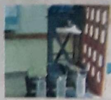
Projeto visa capturar água da chuva para reaproveitamento

O que começou como trabalho para a feira de ciências da escola pode indicar as soluções para os problemas do Jardim Guanabara e bairros vizinhos. O projeto foi acompanhado por seis professores do colégio e professores e estudantes da Escola de Engenharia Civil da Universidade Federal de Goiás.