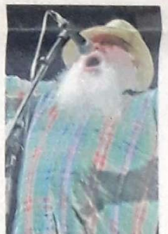
Hermeto Pascoal faz show na primeira noite do Noise Festival

Presidente do Banco Central, Henrique Meirelles disse ontem que, se decidir "pela via eleitoral", deixará o cargo no dia 1º de abril de 2010, prazo final para desincompatibilização. Caso decida não se candidatar a um cargo eletivo, afirmou que permanecerá à frente do BC até 31 de dezembro de 2010. Ele se reuniu ontem em Brasília com a bancada nacional do PMDB. Página 17