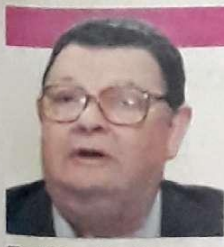
Delfim Netto Sinal de alerta - PÁGINA 11

Ruy Castro Histórias do dia a dia - PÁGINA 7 Medeiros Neto ...e a sombra falou - PÁGINA 21